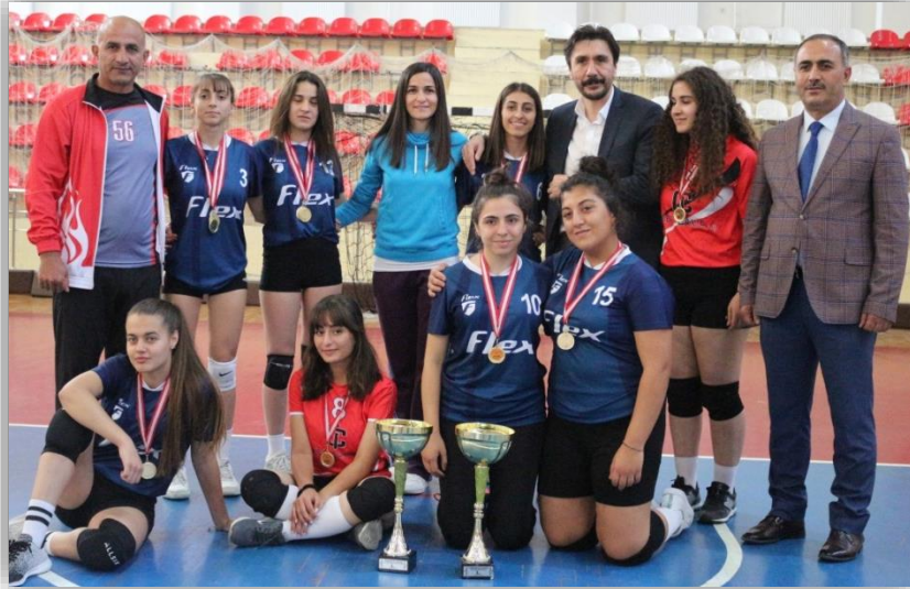
29 Ekim Cumhuriyet Bayramı Etkinlikleri kapsamında voleybol kızlar müsabakasında okulumuz LİSELER ARASI BİRİNCİLİK kazanmıştır.