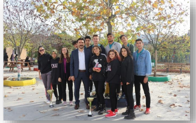
4*100 Metre bayrak yarışında İLÇE BİRİNCİSİ Olan kız takımımız